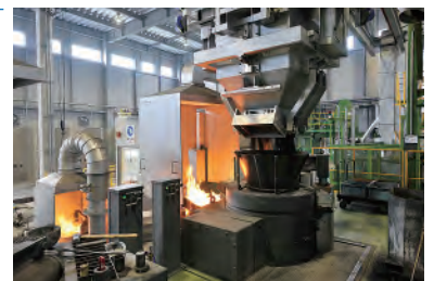
鉛フリー青銅合金鋳造