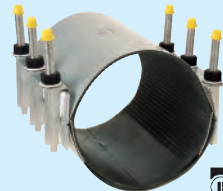
ROMAC INDUSTRIES, INC.