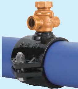
配水ポリエチレン管用