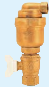
NAV-ODC II 25